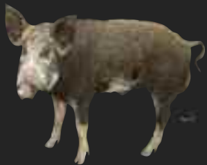
Ferme de Miremont