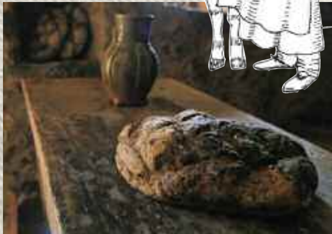
Images tirées de l'ouvrage «Fermes du Moyen Age en Xaintrie», de P. Gire et M.F. Houdart, maiade éd.