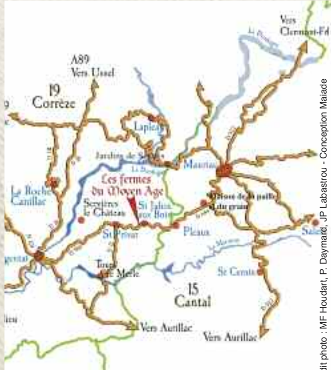
Conception Maiade