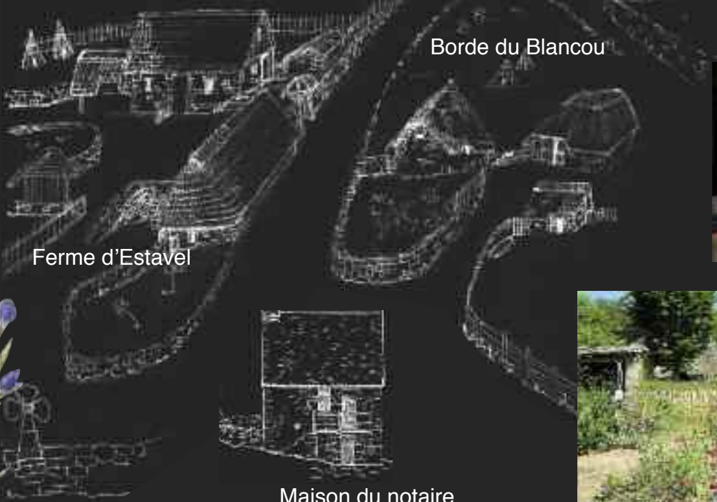
Borde du Blancou