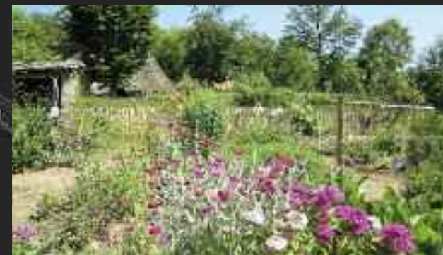
Maison du notaire

Avec ses sept hectares, le Puy d'Arrel, juché à 600 mètres d'altitude, bénéficie d'un panorama exceptionnel sur les montagnes d'Auvergne. Une merveille d'authenticité, de culture et d'harmonie qui s'appuie sur des recherches documentaires, archéologiques et ethnographiques de terrain qui étonnent plus d'un historien.